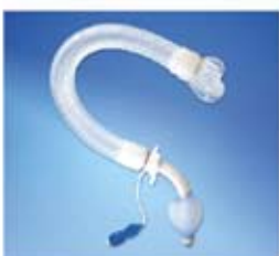
Aparat do terapii wodnej