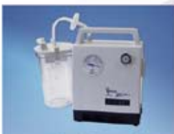
Aparat do odsysania