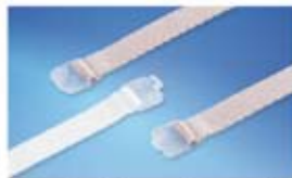
Paski mocujące rurki

Szczegółowe informacje na stronie www.majer.com.pl