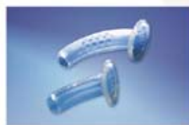
Niemieckie rurki silikonowe