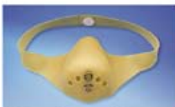
Filtr pod przysznic