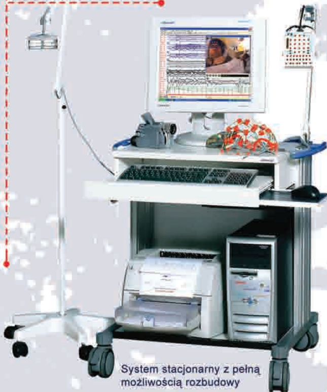
DIGITAL VIDEO EEG (System stacjonarny z Video)

System stacjonarny z pełną możliwością rozbudowy